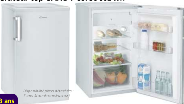
Disponibilité pièces détachées : 7 ans (donnée constructeur)

179€ Garantie 3 ans Livraison IDF 7/7 TOUT COMPRIS ! Prix magasin 219 €