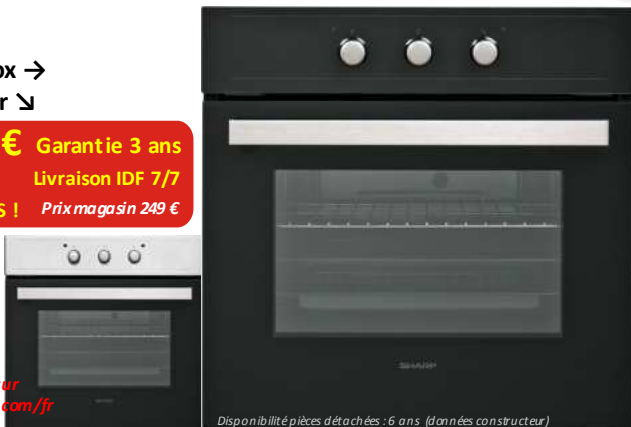
Disponibilité pièces détachées : 6 ans (données constructeur)

+ d'infos sur www.comline.com + d'infos sur www.sharphomeappliances.com/fr