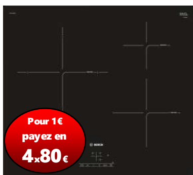
Table induction BOSCH PUJ 611 BB1E

899 € Garantie 3 ans TOUT COMPRIS ! Livraison IDF 7/7 Prix magasin 1199 €