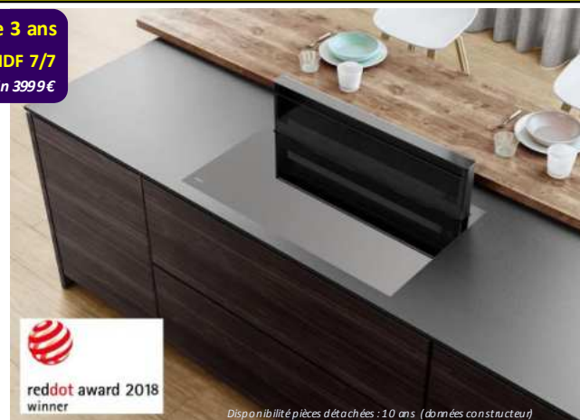
Table induction aspirante Cette table de cuisson avec hotte intégrée ne possède pas seulement un design épuré et intemporel, mais elle s'adapte également à votre style de vie grâce à son ingéniosité technologique. 4 foyers 22x18 cm 3,7 kWh bridgeables. 10 niveaux de puissance. Sans cadre. + d'infos sur www.novy.fr