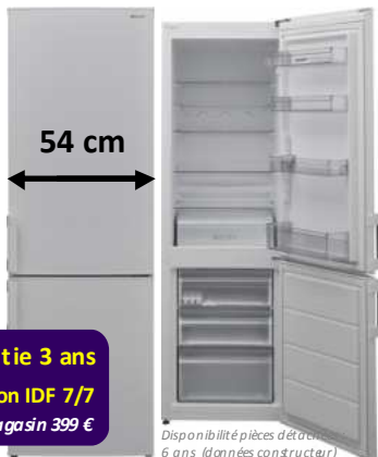
Disponibilité pièces détachées : 6 ans (données constructeur)