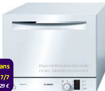
Disponibilité pièces détachées : 10 ans (donnée constructeur)

6 couverts. 6 programmes. Option séchage extra. Départ différé de 1 à 24 h. Boîte à produits MaxiPerformance. HxLxP : 45x55,1x50. Blanc. + d'infos sur www.bosch-home.fr